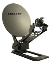
VEHICULAR / DRIVE-AWAY ANTENNA

VSAT решения от IEC TELECOM обеспечивают судходные компании гарантированно высокой пропускной способностью (до 50 Мбит/сек) и многими другими аппаратными опциями: фиксирование, служба запросов, антенна.