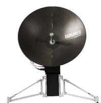
QUICK DEPLOY ANTENNA